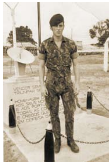
Poste da bandeira

Destaca-se, ao lado dos combatentes e dos líderes político-militares guineenses, a contribuição da população com um trabalho ciclópico no esforço de guerra. Além de contribuir com arroz e víveres em geral para a alimentação dos combatentes 16 a população era amiúde sujeita a privações de toda a sorte, nomeadamente ataques da aviação e de destacamentos do Exército português apeados ou ainda ataques