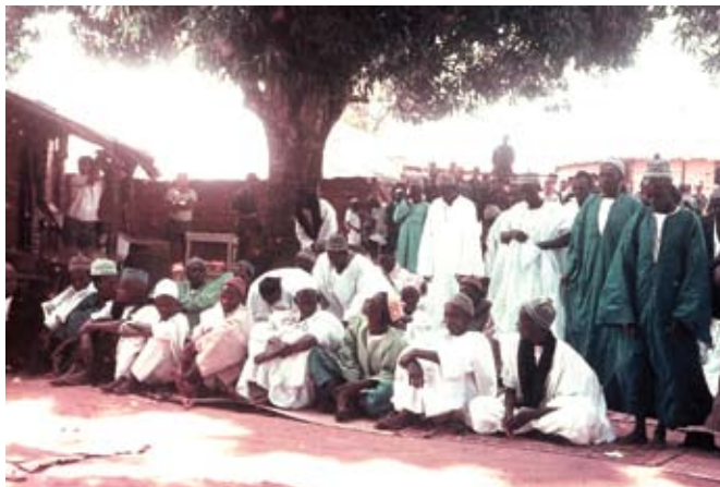
População do quartel

A transmissão, quase exclusivamente oral desses conhecimentos, coloca problemas à investigação e à escrita da História, à medida que o tempo passa e se afasta das suas fontes primárias. Convenhamos que, o desaparecimento físico dos actores directos e indirectos e as testemunhas da epopeia de Guiledje,