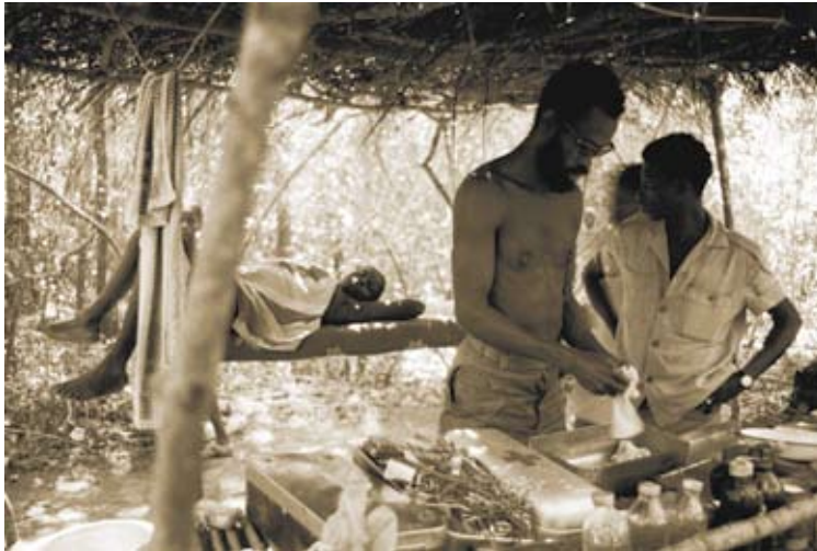
Parto por médico cubano

O povo da Guiné-Conakry participou no esforço de guerra do PAIGC em Guiledje e nas frentes Sul e Leste. pagando por isso um pesado tributo. O apoio político, logístico e militar fornecido por esse país ficou para sempre registado nas mentes e corações dos combatentes e da população de Guiledje. No contexto geral da luta de libertação nacional da Guiné-Bissau, embora em menor grau, o povo senegalês também deu o seu contributo sob diversas formas.