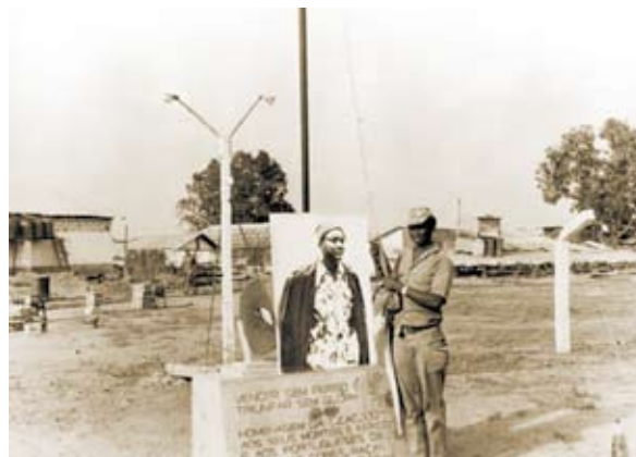
Tomada de Guiledje