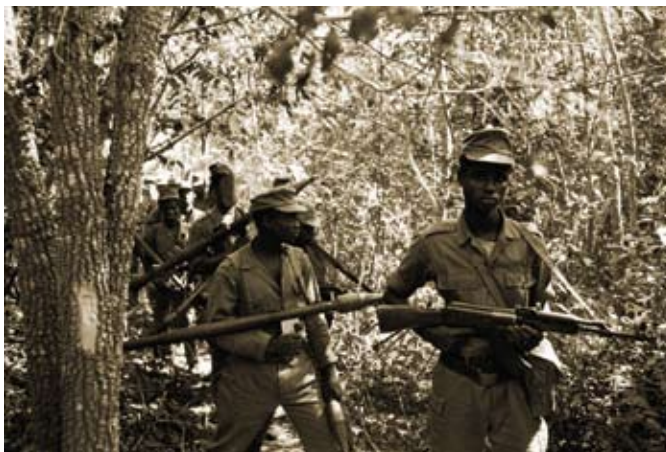
Coluna do PAIGC