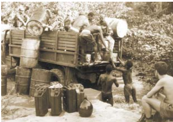
Carregamento de Água