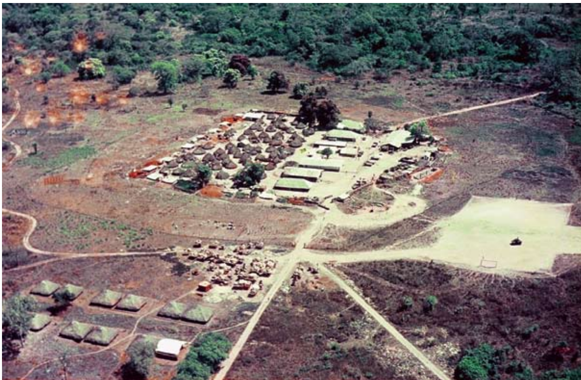
Vista aérea do quartel