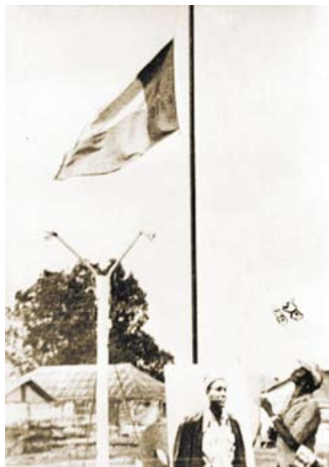
Hastear da bandeira do PAIGC

Por ironia do destino, talvez a intensidade e a violência dos combates ali travadas possam explicar a inaudita rapidez e a eficácia