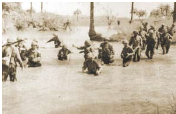
Missão fora do quartel

Três aspectos foram decisivos para o desalojamento do quartel de Guiledje pelas FARP: o assassinio de Amílcar Cabral que conduziu a uma Operação com o seu nome 11 e ao recrutamento de acções militares com uma inaudita violência