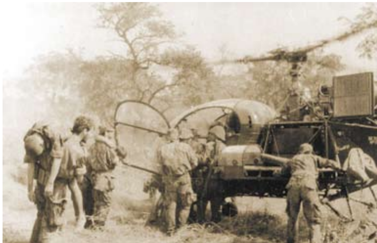
Evacuação de feridos